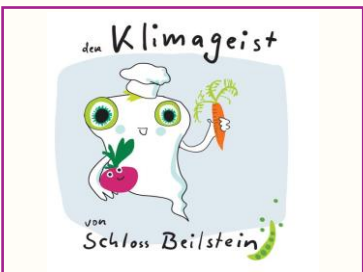
Der Klimageist vom Schloss Beilstein